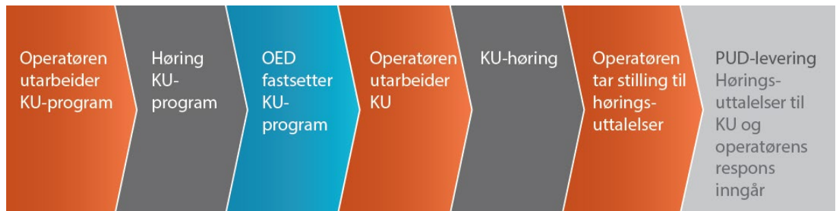
Figur 3 Tidslinje for konsekvensutredning