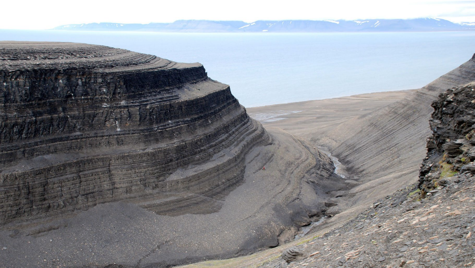
Bilde fra Edgeøya med eksponering av kildebergarten Steinkobbe-/Botneheiaformasjon, Trias alder.