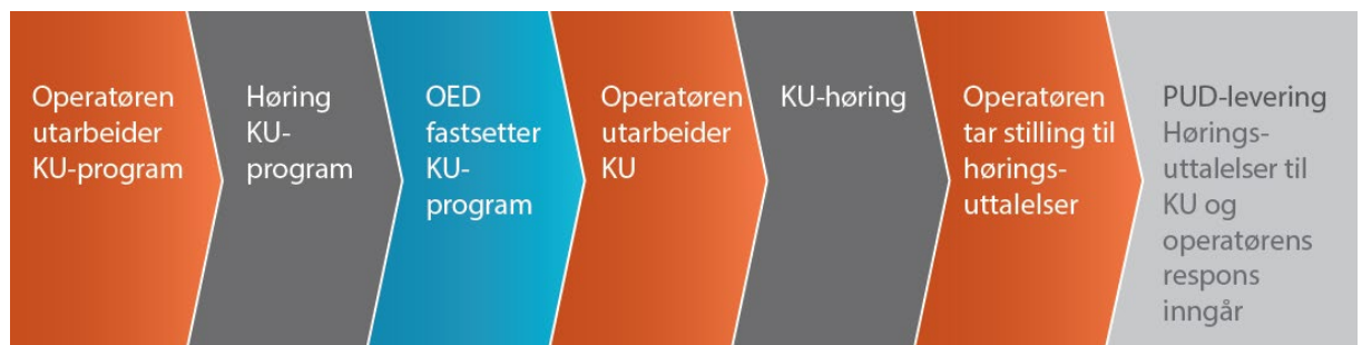
Figur 3 Tidslinje for konsekvensutredning